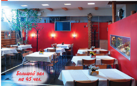
Большой зал на 45 чел.

Обслуживание свадеб, банкетов, юбилеев, корпоративных вечеринок.