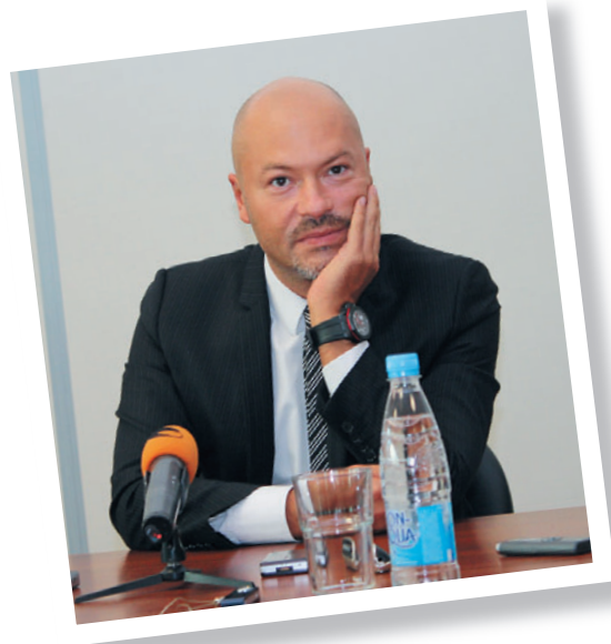
Гость номера – Федор Бондарчук