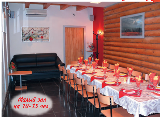
Малый зал на 10-15 чел.

На лице улыбка, в душе позитив, все это будет «Луч» посетит!