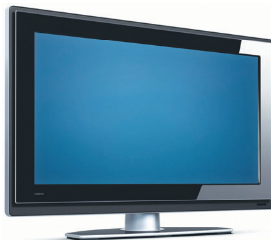
Счастливые победители лотереи по «Карте привилегий»