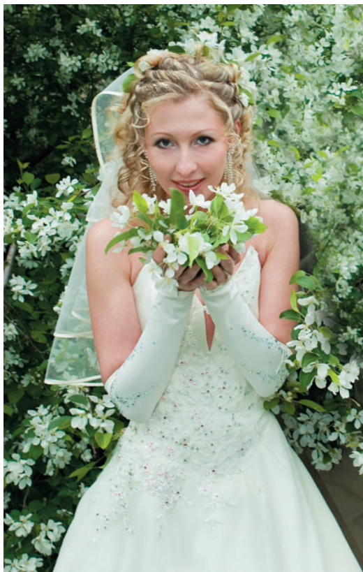
Образ весенней невесты