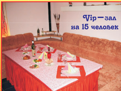
VIP-зал на 15 человек

г. Верхняя Пышма, ул. Чкалова, 87, тел.: (834368) 51542, 8-922-20-22-204, oooisup@e1.ru