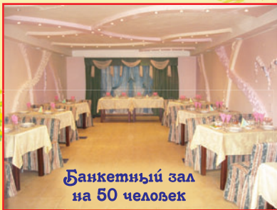
Банкетный зал на 50 человек

Принимаем заказы на проведение торжеств: свадьбы, юбилеи, банкеты и корпоративные вечеринки