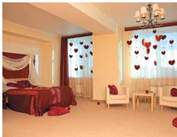
Отель «Де Пари»

Ул. 8 Марта, 50. Тел. (343) 257-42-06, www.hotel-erm.ru