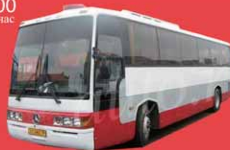
Автобус Mercedes Транстар 45 мест, DVD, музыка, кондиционер