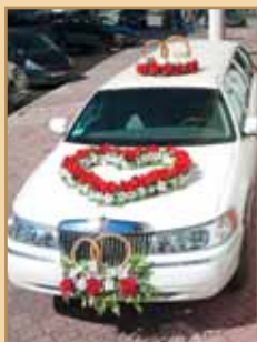
Оформление авто, прокат VIP авто