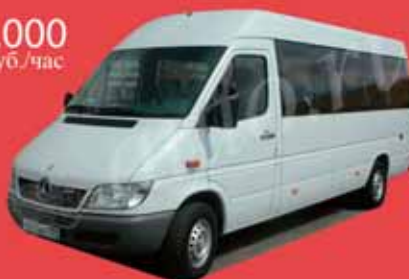
Микроавтобус Mercedes Спринтер 18 мест, DVD, музыка, кондиционер.