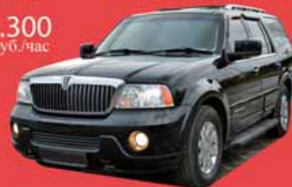
Линкольн Навигатор, 2005 г.в. 6 мест, белый кожаный салон.