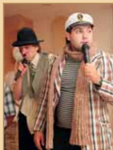
Лучшие ведущие, артисты, шоумены

Мы организуем ваш праздник профессионально, в соответствии с последними тенденциями моды. Наша компания располагает собственным автопарком современных лимузинов и VIP-автомобилей