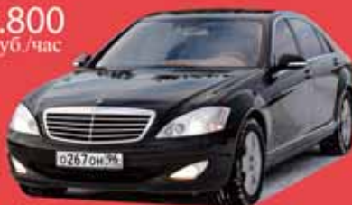
Mercedes S500L, W221, 2008 г.в. светлый кожаный салон, ТВ, DVD