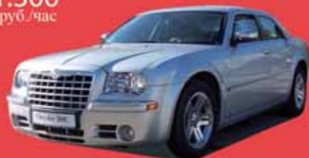
Крайслер 300С, 2008 г.в. белый кожаный салон