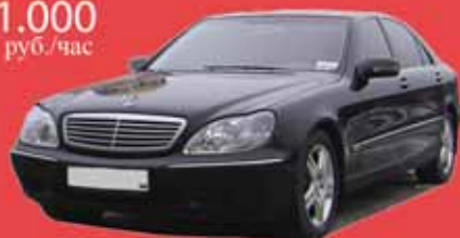
Mercedes S600L W220, 2005 г.в. Единственный настоящий S600 в прокате