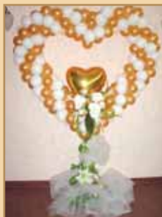
Роскошное оформление залов