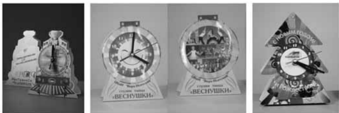
НАСТОЛЬНЫЕ ЧАСЫ ПО ИНДИВИДУАЛЬНОМУ ЗАКАЗУ