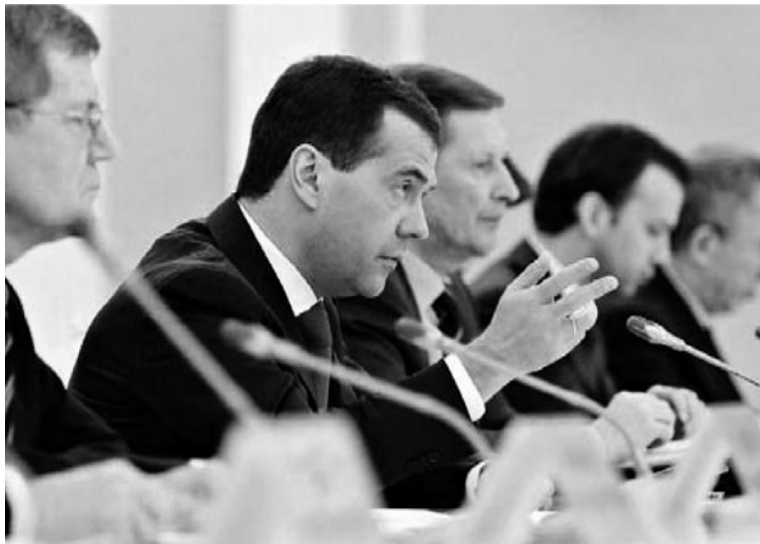
Дмитрий Медведев хочет, чтобы чиновники и их родственники жили по средствам

В их числе так называемая конфискация in rem — конфискация, основанная на переносе бремени доказывания законности происхождения имущества, в отношении которого имеются подозрения о его коррупционном происхождении, на заинтересованное