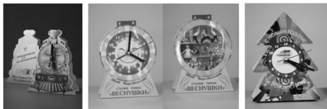
НАСТОЛЬНЫЕ ЧАСЫ ПО ИНДИВИДУАЛЬНОМУ ЗАКАЗУ