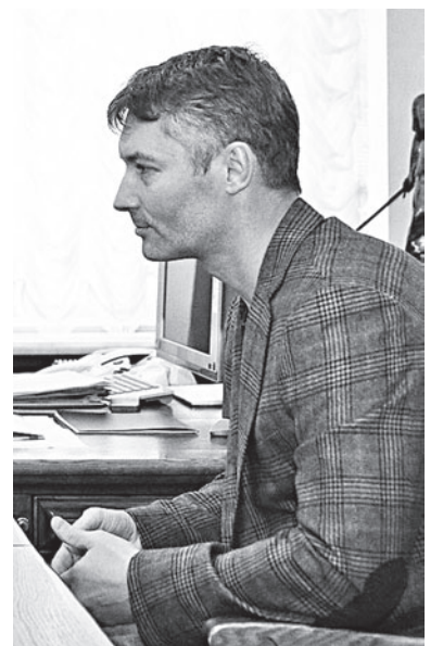
Получить подтверждение от самого мэра пока не получается - на связь он не выходит.

следить непосредственно за реконструкцией, вторая - по закупкам транспорта и тратам на него, третья - за подготовкой баз и так далее. А координировать это все Евгений Куйвашев предложил Евгению Ройзману, который весьма категорично высказывался против реконструкции и намеревался некоторое время назад ей противостоять. Возможно, таким образом область стремится обезопасить себя от активной кампании против реконструкции, пытаясь сделать одного из его вдохновителей непосредственным участником процесса, хоть и с функциями критика. Как сообщают источники, Евгений Ройзман обещал подумать над предложением.