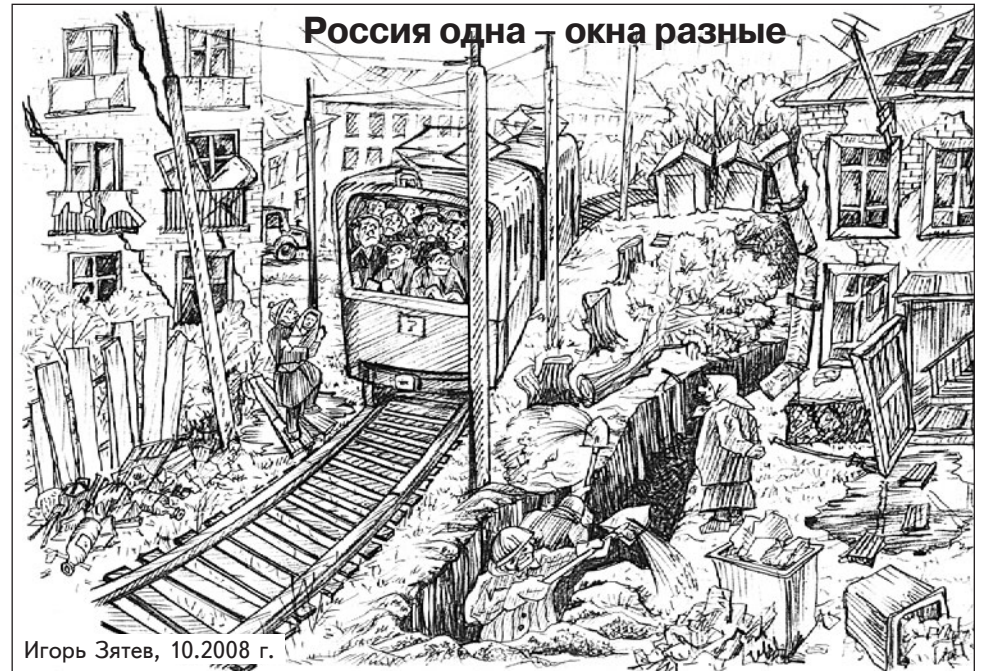
Игорь Зятев, 10.2008 г.