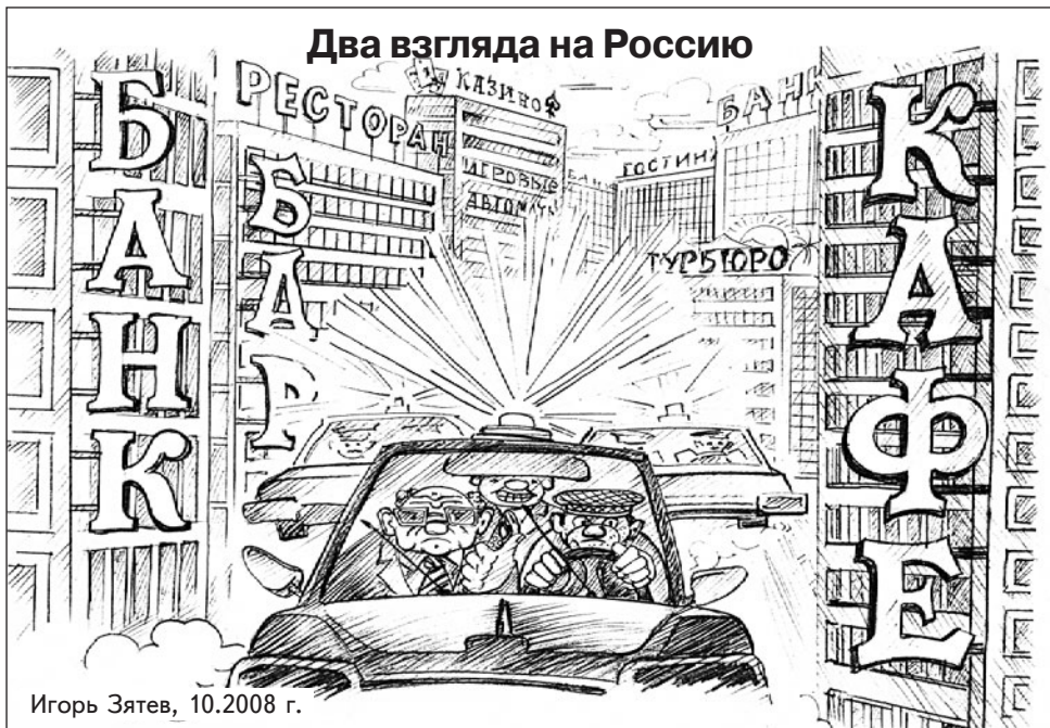
Игорь Зятев, 10.2008 г.