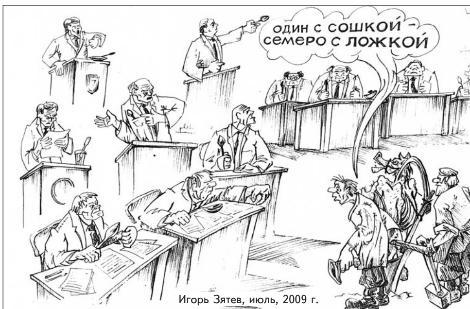
Игорь Зятев, июль, 2009 г.