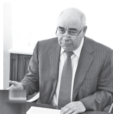
Глава минздрава области Аркадий Беляевский

Сразу два министра правительства Свердловской области оштрафованы судом за нарушения законодательства в сфере закупок. Иски подала прокуратура.