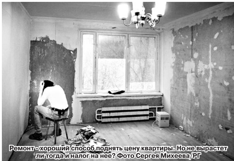
Ремонт — хороший способ поднять цену квартиры. Но не вырастет ли тогда и налог на нее?

Владельцы квартир, особняков и дач будут платить налог на все это имущество по новым правилам. Его рассчитают не по инвентаризационной стоимости, как сейчас, а по кадастровой, которая, как правило, значительно больше.